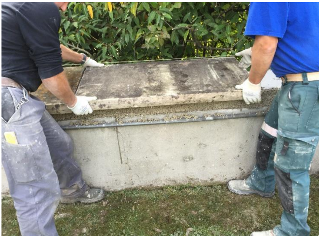
Versetzen der Sandsteinplatten frisch in frisch