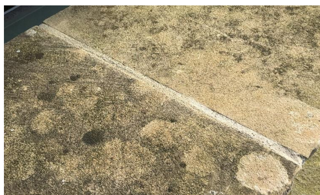
Verfugen mit Trass 500 angemischt mit RS SAN