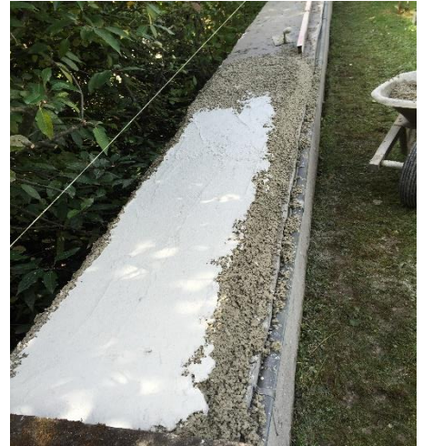
Haftschlämme ACOTOP WEISS