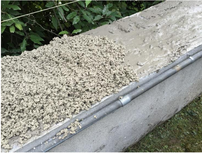
Grobkornbeton mit Trasszement Compound TCE